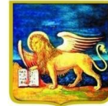
REGIONE DEL VENETO

Fondo europeo agricolo per lo sviluppo rurale: l'Europa investe nelle zone rurali